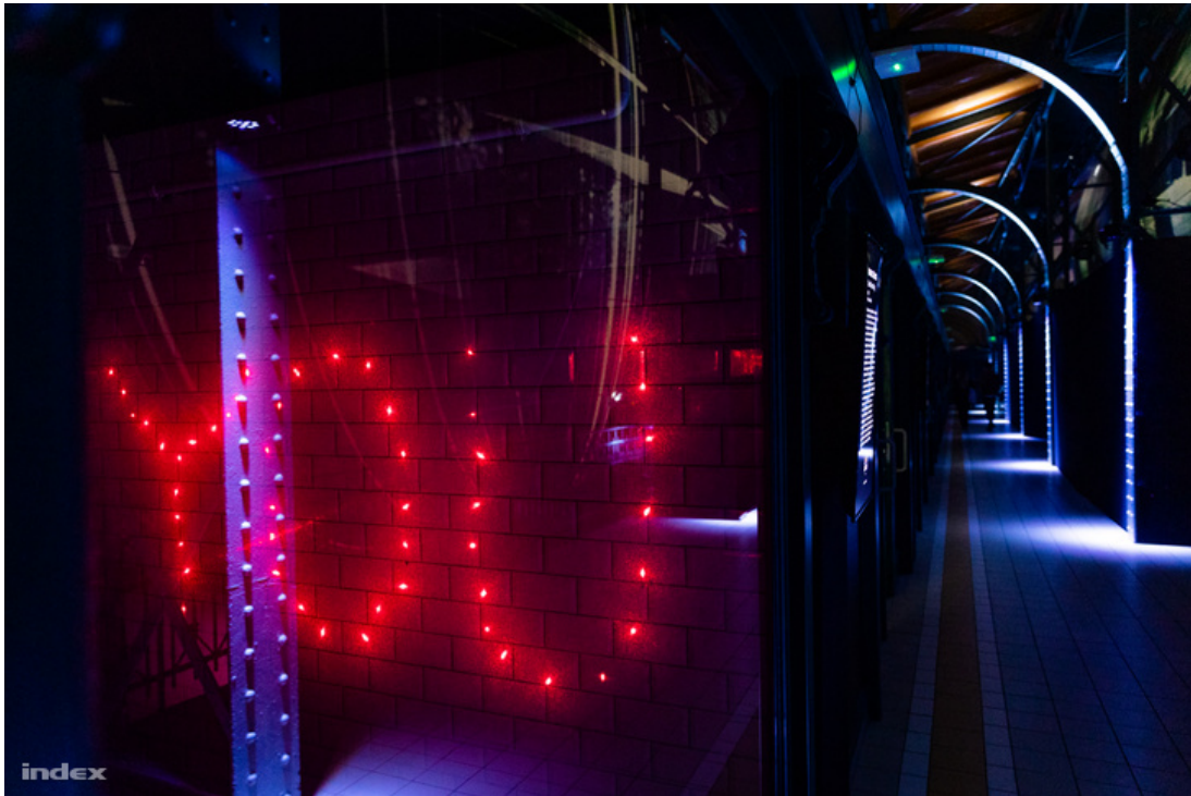
Galéria: A most nyílt budapesti fényművészeti múzeum az egyik legmenőbb hely az országban

A fényművészet egyik lehetősége, hogy olyan hatásokat ér el, amelyek tágítják a percepciót, megtanítanak látni, hogy jobban megértsük, hogy milyen tér vesz bennünket körül.