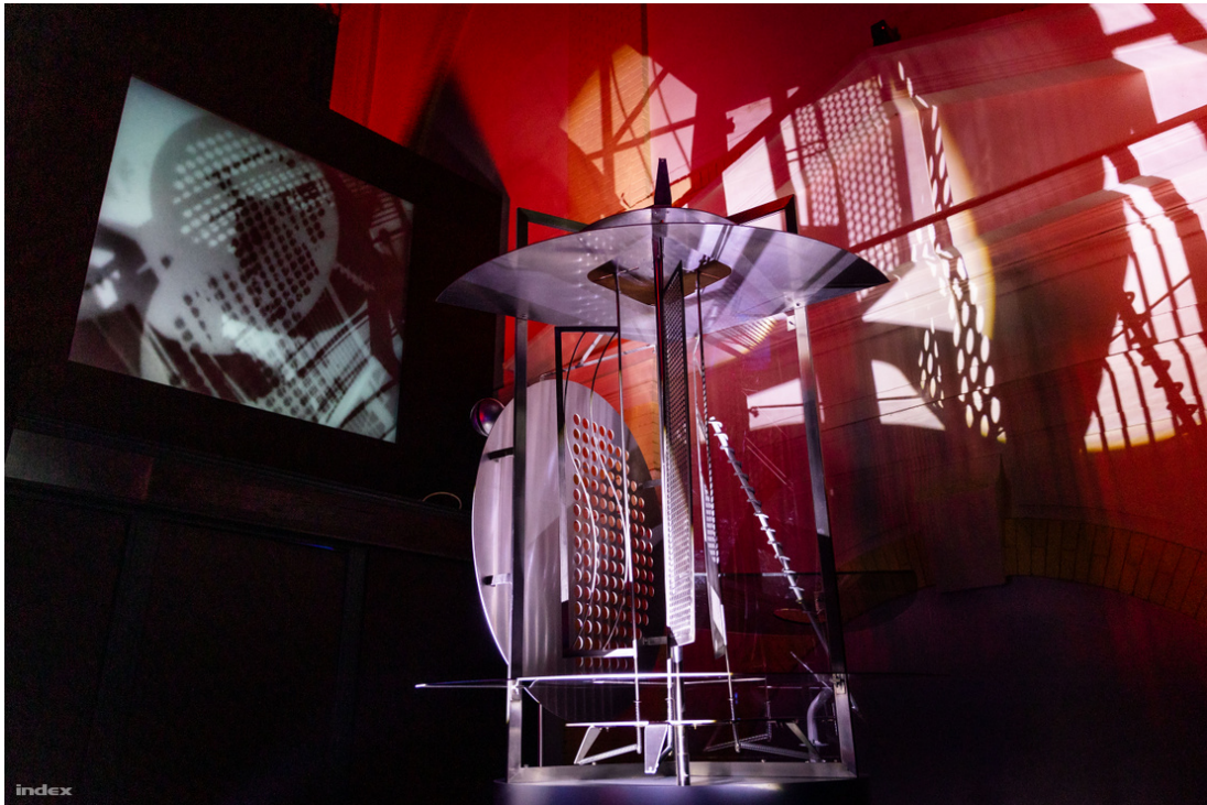
Galéria: A most nyílt budapesti fényművészeti múzeum az egyik legmenőbb hely az országban

Ha a múzeummal egy-egy Instagram- vagy TikTok-megosztásból találkozunk először, úgy is lehet értelmezni, hogy termeiben csak a külsőn érvényesül, ám a látványos installációk mögött mélyen rétegzett gondolatok vannak, és ez nem kis szerepet játszik abban, hogy a tárlat nemzetközi szinten is mérvadó.