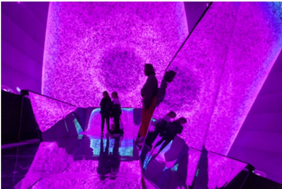
Galéria: A most nyílt budapesti fényművészeti múzeum az egyik legmenőbb hely az országban

Az installációk valóban széles skálán mozognak, és az a tény, hogy minden, amit a kiállításon látunk, magyar művészek munkája, még különlegesebbé teszi az élményt.